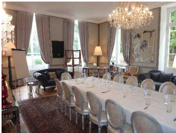
SALLE DE SÉMINAIRE AU CHÂTEAU