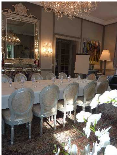
SALON GRIS DU CHÂTEAU